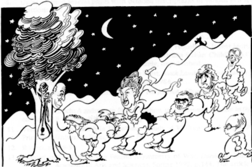
Abb. 2: Serbische politische Orgie.